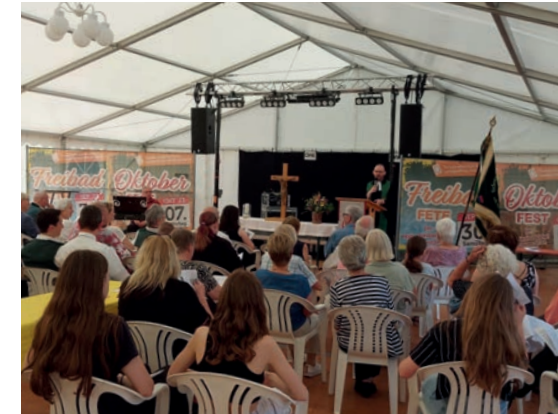
Gottesdienst im Festzelt zum Schützenfest