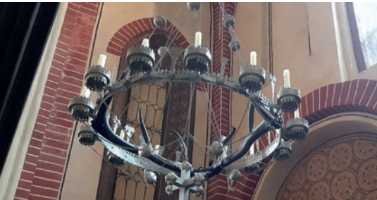
Radleuchter aus dem 15. Jahrhundert.

Wenn sie die Kirche betreten haben, fallen ihnen zuerst die vielen prachtvollen Leuchter auf. Der älteste und unscheinbarste hängt im südlichen Seitenschiff hinter der Kanzel. Das eingearbeitete Hirschgeweih soll von einem Hirsch stammen, der nach einer Hetzjagd in die Kirche flüchtete und dort verendete.