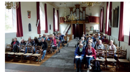
Gemeindeausflug 2019 nach Bourtagne

diesem Preis sind Fahrt, Stadtführung, Museumsbesuch und Tee, Kaffee und Kuchen enthalten. Das Mittagessen dagegen müssen die Teilnehmer vor Ort selbst bezahlen. Wer an dem Ausflug teilnehmen möchte, der wird gebeten, sich bis zum 9. September anzumelden: entweder online über www.kirche-friedeburg.de oder telefonisch im Pfarramt unter 04465 8877. Teilnehmer aus den umliegenden Ortschaften sind ebenfalls willkommen.