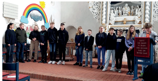
Vorstellungsgottesdienst 2023 in Etzel