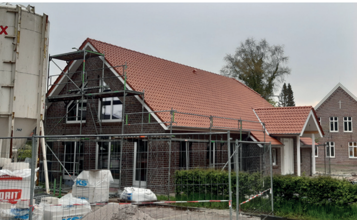
Im Vordergrund neugebautes Gemeindehaus; im Hintergrund ehemaliges Pfarr- und Gemeindehaus schon umgebaut

Über dem Eingang steht ein schlichtes eingemauertes Kreuz. Es symbolisiert den Grund auf dem wir als christliche Gemeinde stehen: