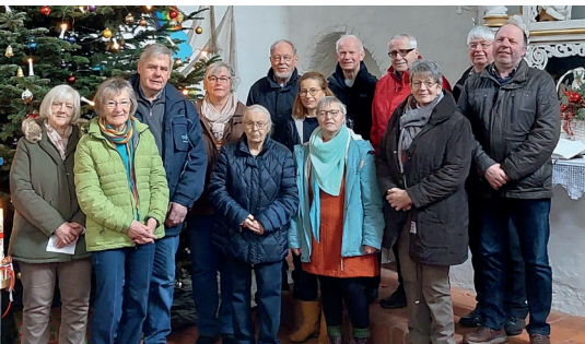
Platt Kring Harlingerland

Aufmerksame Stille erfüllte den Kirchenraum, als am Sonntag Okuli, dem 12. März, vier Mitglieder des Plattdüütsk Kring Harlingerland ihre Predigtbeiträge vortrugen. Zur Jahreslosung „Du büst en Gott, de mi sücht“ erzählten sie von Erfahrungen aus ihrem eigenen Leben zu diesem Thema. Gesehen werden und damit von Gott als wertvoll anerkannt zu werden, das hatten sie in ganz unterschiedlichen Situationen gespürt. Besonders bei Belastungen wie Trauer oder Krankheit bedeutete dieses Gesehen-Werden eine wichtige Stärkung. Die Zuhörer konnten im Stillen Parallelen ziehen zu ihren eigenen Erfahrungen. Viele waren nach eigenem Bekunden tief bewegt und schöpften Mut für den eigenen Lebensalltag. Gerade, dass theologische Laien hier so ganz praktisch und anschaulich von ihrem Gottvertrauen erzählten, überzeugte die Zuhörer. Wiederholt wird der Gottesdienst am 18. Juni um 10 Uhr in Ochtersum und am 24. September um 19 Uhr in Carolinensiel.